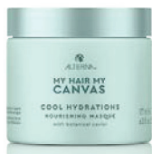
COOL HYDRATIONS MASQUE