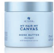
MORE BUTTER MASQUE.

Un acondicionador vegano y sin silicona que hidrata, desenreda y desencrespa todas las texturas a la vez que mejora la definición y la forma de los rizos.