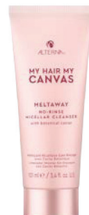
MELTAWAY NO-RINSE MICELLAR CLEANSER.

Spray de fijación flexible que proporciona protección contra la humedad y el calor hasta 232°C.