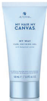
MY WAY CURL DEFINING GEL.

Un alargador de rizos vegano y sin silicona que alarga los rizos desde el primer uso y ayuda a mantener el patrón de los mismos.