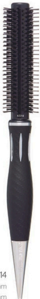
KS14 Head 18mm Bristle 36mm