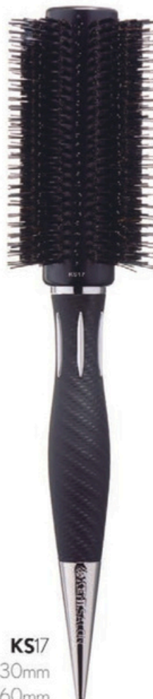
KS17 Head 30mm Bristle 60mm