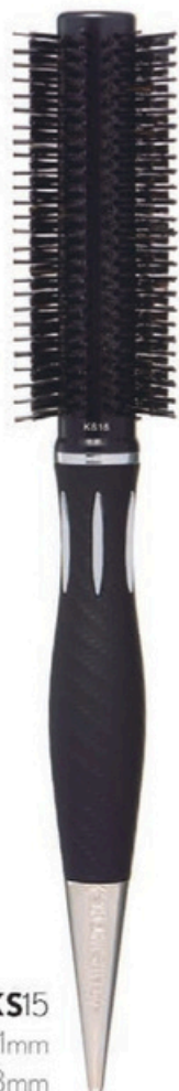
KS15 Head 21mm Bristle 43mm