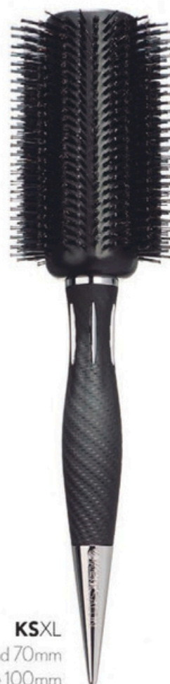
KSXL Head 70mm Bristle 100mm