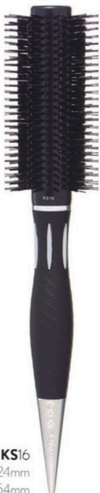
KS16 Head 24mm Bristle 54mm